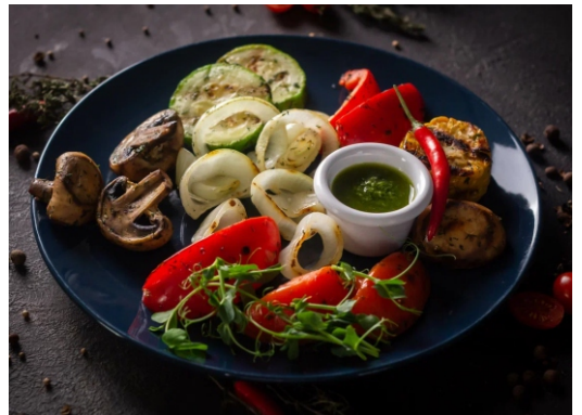
АССОРТИ ОВОЩЕЙ НА ГРИЛЕ