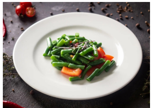
ФАСОЛЬ СТРУЧКОВАЯ С ТОМАТАМИ