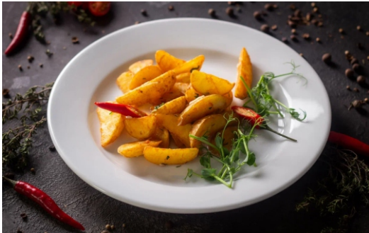
КАРТОФЕЛЬНЫЕ ДОЛЬКИ запеченные