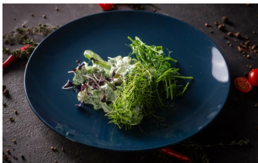
БРОККОЛИ В СЛИВОЧНОМ СОУСЕ