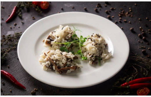
ДИКИЙ РИС С ШАМПИНЬОНАМИ